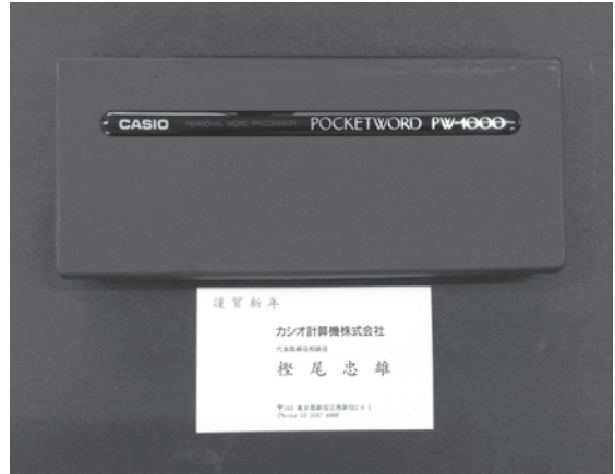
図2 10枚目の名刺とその戦利品

しなど、それなりの費用を請求された。成形メーカー、セットメーカーの双方から責められた。書いた始末書は割愛するが、「人は打たれて強くなる」。直取引から学んだことは、「自立心」と「理論武装」、さらにもう一度「自立心」。