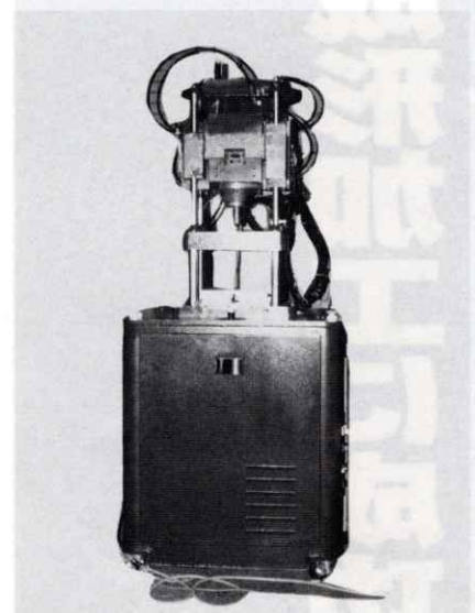
スクリーインジェクションマシン「BeVeL」

「こういう問題は、日本人が欧米の技術に弱いということですよ。先入観念に縛られ誰も手を加えなかったのではないですか?。ガラス60%で商品化しているものもあるとは聞いているが、繊維長8mmでやってもズタズタになってしまう部分もある。私たちはそうい