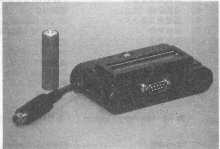
Count/Memory Cupselに接続 8P Din Connector