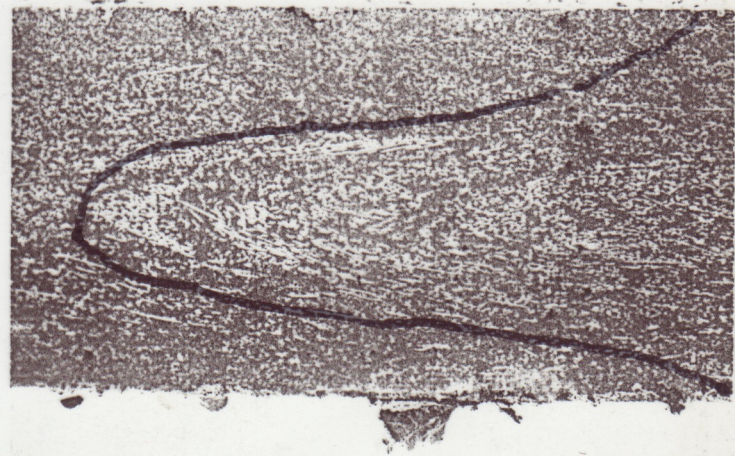
写真-2 コントロール (A-A断面)